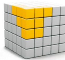
KMU 's in OWL, Deutschland und Europa