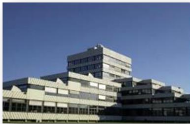
Hochschule Ostwestfalen-Lippe University of Applied Sciences